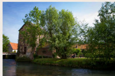
Moulin de tigny

Bien que l'intérieur ne se visite pas, son architecture extérieure remarquable constitue l'un des points forts de cette randonnée. Depuis le sentier, prenez le temps d'admirer cet édifice, symbole d'une époque où la force de l'eau rythmait la vie et l'activité économique du village.