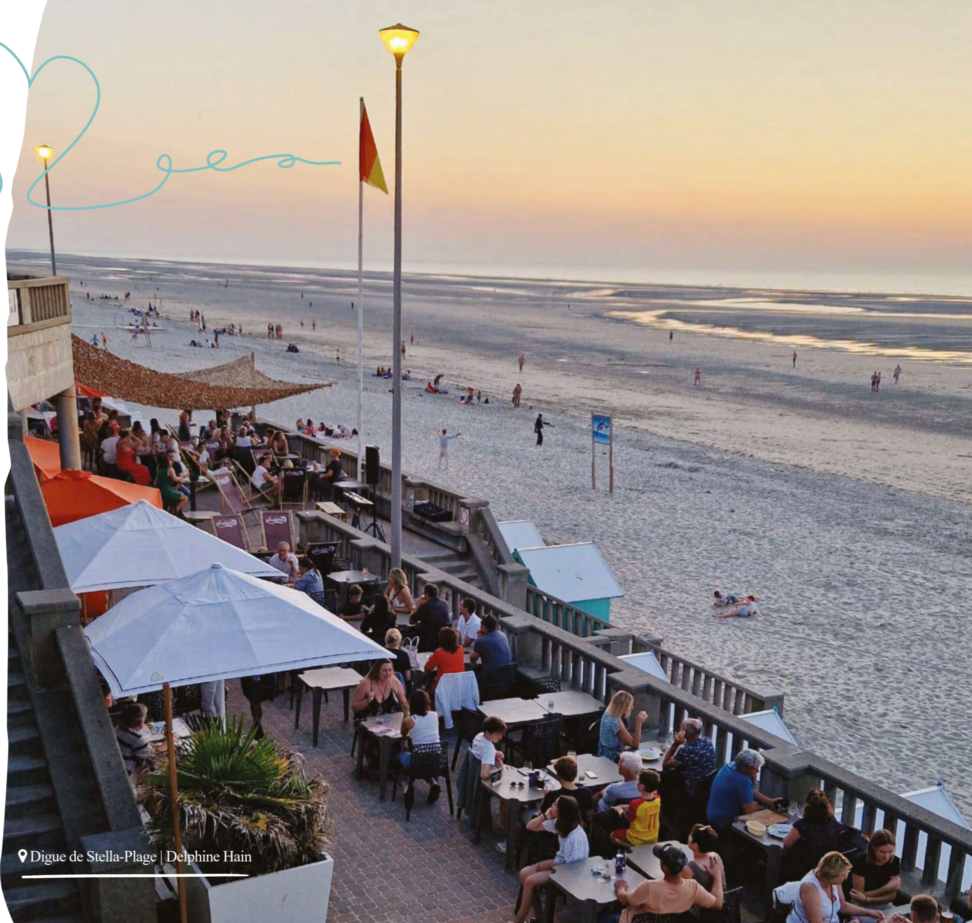
📍 Digue de Stella-Plage | Delphine Hain