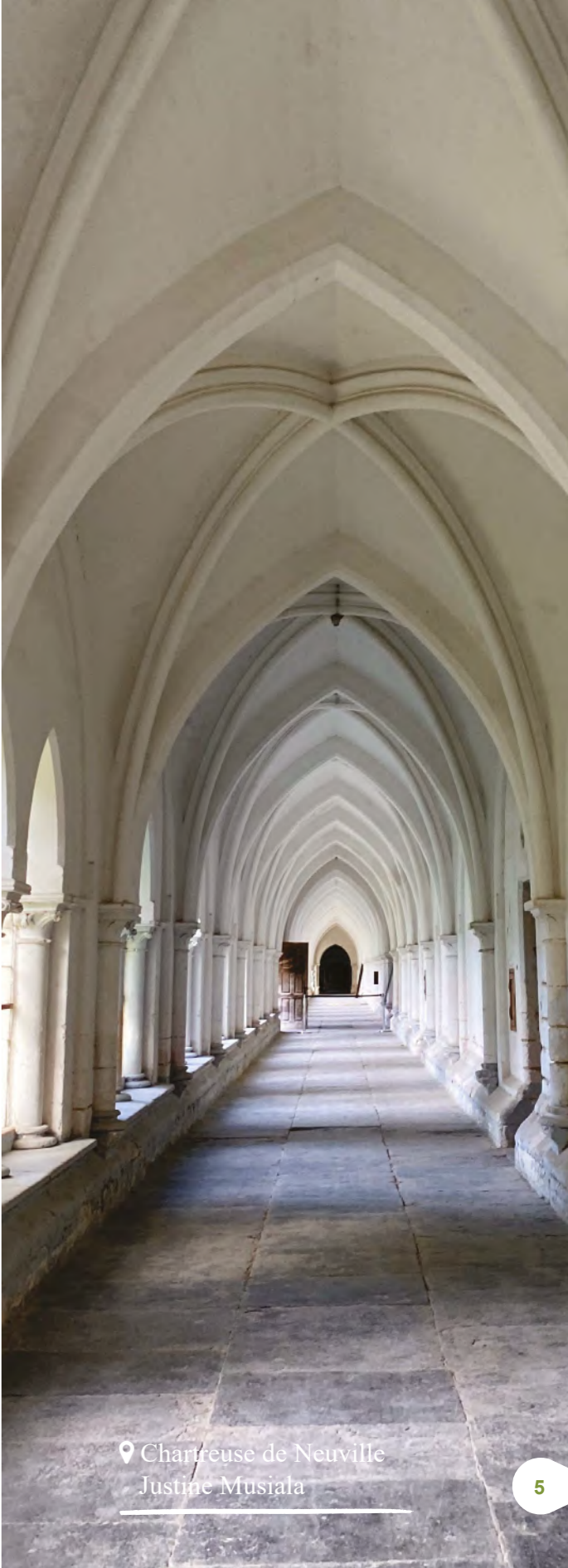
Chartreuse de Neuville Justine Musiala