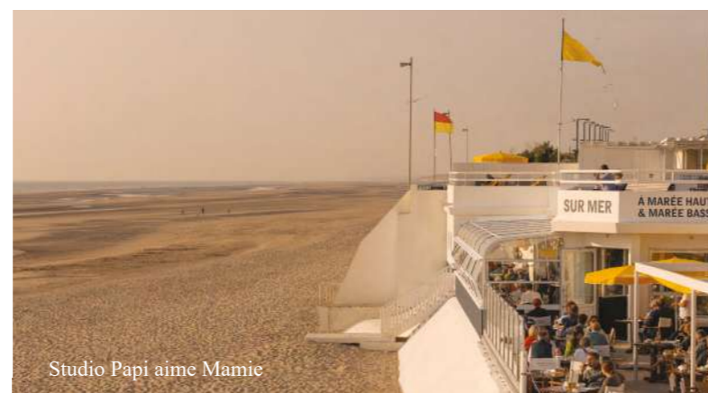
Studio Papi aime Mamie