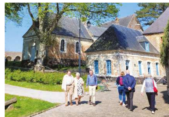
La tour blanche | Jean-Michel Graillet

👉 Dormir à la citadelle : Auberge de Jeunesse "La Hulotte" Entre 20 et 25€/nuit j.gosselin@citadelle-montreuil-surmer.fr