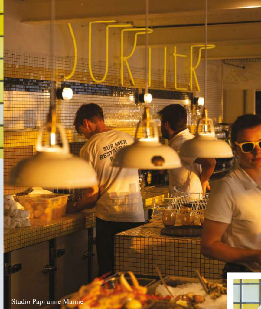
Studio Papi aime Mamie