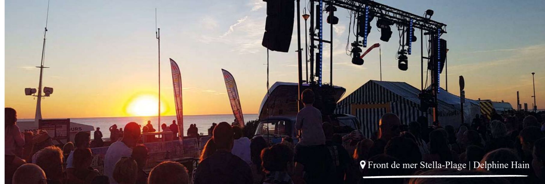
📍 Front de mer Stella-Plage | Delphine Hain