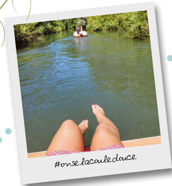
#onse lacoule douce

Tous sur le pont, larguez les amarres et hissez la grand-voile ! Oups, on s'emballe un peu... On vous rassure, ici pas besoin de permis bateau. Les barques électriques sont très simples à manier... " Mais tourne Céline, toooourne ! Attention à la branche, baissez-vous ! ". Oui oui, avec le Petit Quentovic, on vous promet une escapade en toute sérénité et garantie sans pirates ni requins (mais choisissez bien votre capitaine de bord parmi votre bande de moussaillons d'un jour...).