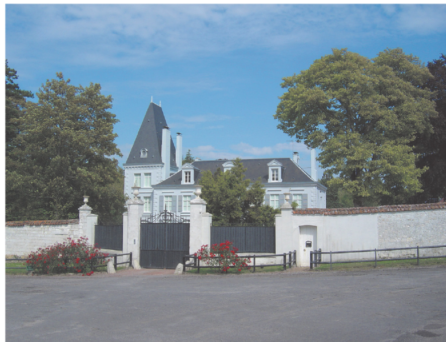
Château de ST Josse